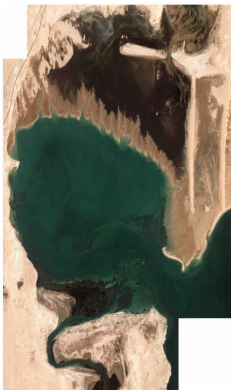
Vue partielle de la baie de l'Etoile

Bénéficiant de méthodologies mises au point dans le cadre de travaux menés récemment sur les marais salés des côtes Ouest européennes (sous l'égide de l'Union Européenne) et particulièrement en baie du Mont-Saint-Michel (France), le programme de recherches en baie de l'Etoile peut aussi servir de modèle expérimental pour -conformément aux recommandations du 5 ème groupe de travail IMROP- appréhender ce que sous-tend la notion d'approche écosystémique prônée par la plupart des halieutes. Dans une baie aussi complexe, il s'agit d'évaluer les possibilités d'échanges de matière organique et d'énergie entre les différents secteurs qui la composent (rivière, marais à spartines,