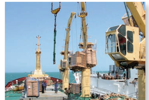
Opération de transbordement des captures de bateaux de pêches pélagiques

1 Une campagne de presse virulente à l'encontre de cette pêcherie a été menée suite à l'entrée en activité de ce bateau irlandais de 144 m. Ainsi, un journal national a illustré le danger représenté par ce navire en insérant une photo d'un porte avion. Le Guardian, journal anglais à grand tirage, a affirmé que ce bateau pêche en un jour ce que 10 bateaux de pêche locaux (pêche artisanale?) capturent en une année. Le Marin, un journal spécialisé français, a été jusqu'à mentionner que celui-ci travaillait en toute illégalité.