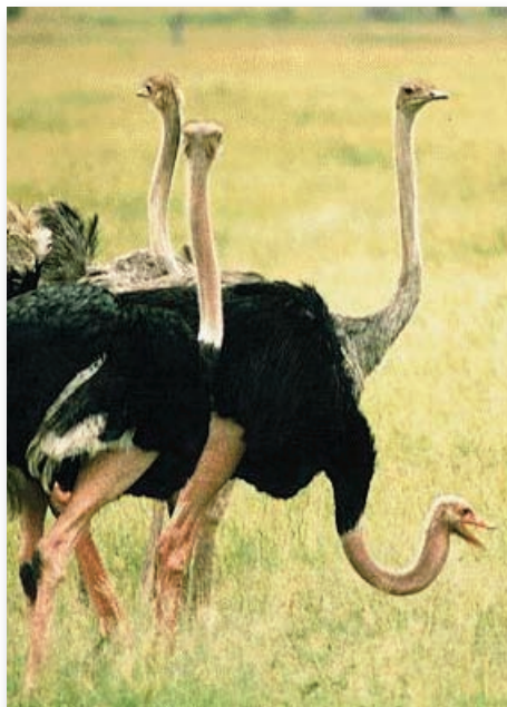
La disparition de cette luxuriante végétation et ces troupeaux d'autruches a profondément marqué Bilal

communauté. En contre partie de son soutien à la mesure d'interdiction officielle de sa chasse, une autorisation spéciale a été accordée à ce chef traditionnel d'en tuer un individu par an pour ses besoins. Ce fut fatal à cette espèce. D'ailleurs, Bilal n'arrive pas à s'expliquer les raisons qui ont emmené les autorités de l'époque à interdire de nouveau la chasse de l'autruche du moment que cette interdiction est déjà inscrite tacitement dans le code de conduite de cette communauté.