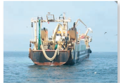
Bateau de pêche pélagique européen opérant dans les eaux mauritaniennes

Dès la fin des années soixante, une formidable « armada » multinationale de pêche pélagique travaillait dans la zone. Elle était composée d'une part de navires usines avec chacun leurs flottilles « filles » de petits senneurs et d'autre part de chalutiers pélagiques usines autonomes congelant, fabriquant de la farine et de l'huile à bord et même certains des conserves appertisées. La flottille d'Interpêche, dont le navire usine avait une longueur de 201 m et jaugeait 12 000 TJB était parmi les plus importantes. Ces senneurs nord-européens étaient en fait originaires d'Afrique du Sud battant pavillon néerlandais ou norvégien.